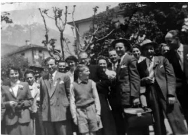
Der Kirchenchor der 50-er Jahre auf Reisen.

Auch damals ging der Kirchenchor gelegentlich auf Reisen, wenn kaum jemals über die Kantonsgrenzen hinaus. Die Kinder der Chormitglieder durften mitfahren, ein Ereignis der ganz speziellen Art, waren Carreisen, weil sehr selten, für uns damals ein Luxus.